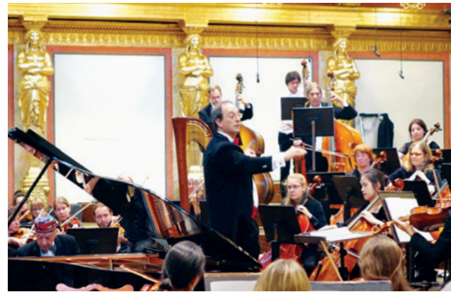
Neues Zürcher Orchester im Goldenen Saal im Musikverein Wien, am Klavier Paul Badura-Skoda

Ist eine Weiterentwicklung und Erweiterung der 1998 aus Anlass des 150-jährigen Bestehens der modernen Schweiz ins Leben gerufenen Schweizer Philharmonie (Swiss Philharmonic Orchestra). Motto: «Klänge für einen guten Zweck»: Symphonischer Sympathie- und Botschaftsträger für die Schweiz nach innen und außen sowie als Plattform für interaktive und praxisbezogene musikalische Nachwuchsförderung z. B. im Rahmen von Benefiz-Veranstaltungen (Zusammenarbeiten bisher mit Green Cross, Unicef, Berghilfe, Glückskette). Setzt sich hauptsächlich aus gestandenen MusikerInnen sowie aus Nachwuchstalenten zusammen.