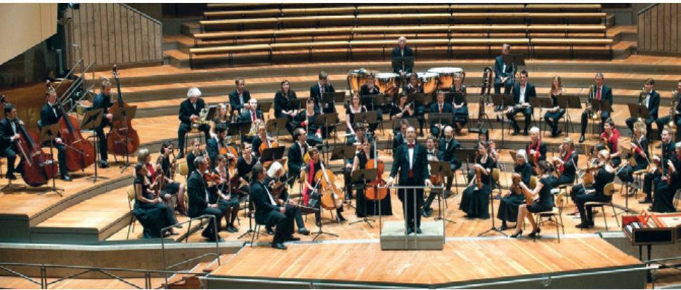
Swiss Philharmonic Academy Orchestra in der Berliner Philharmonie